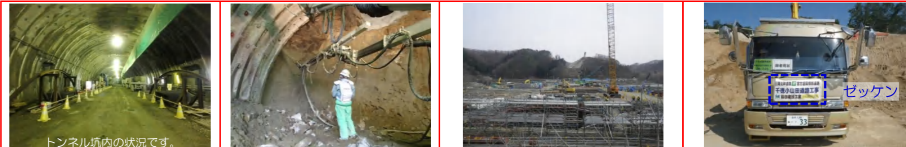
トンネル坑内の状況です。