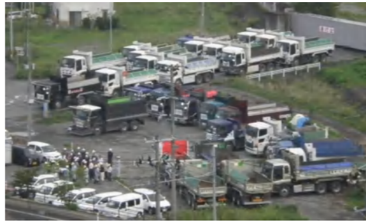
最盛期のダンプ集合写真