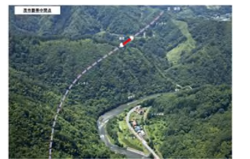
茂市～腹帯地区写真