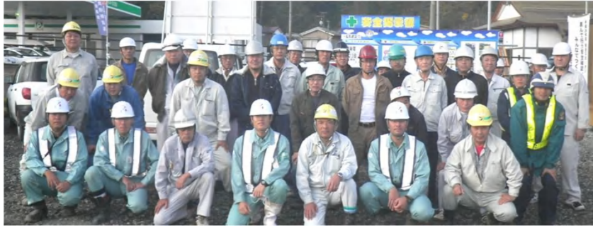
松尾建設4名、玉石重機29名(内ダンプ運転手23名)、新生警備保障2名